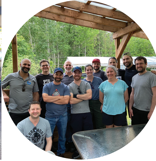
PRATT ET WITHNEY AUX JARDINS DE LA CROISÉE