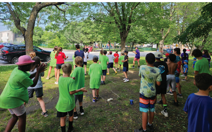
CAMP DE JOUR 2023