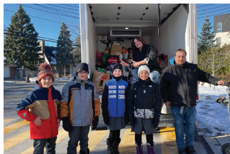
DONS POUR LA GUIGNOLÉE