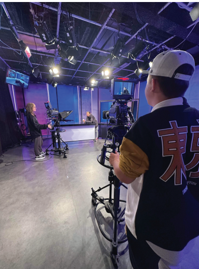
JEME VISITE TVRS