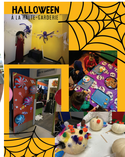
HALLOWEEN AU P'TIT GALOP